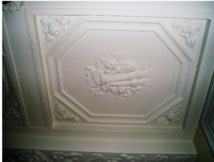
Stuk på Herningvej 3.

I 1980'erne hvor kreditforeningen (nu Nykredit) manglede plads til de mange nye medarbejdere, så indrettede man tagetagen til kontorformål. Dog undlod man at udnytte de sidste ca. 25 m 2 , som indeholdt pyramiden oven over bankboksen. Det var ellers planen, at den blot skulle fjernes, da man ikke længere havde fysiske beholdninger af obligationer. Pyramiden var simpelt hen så massiv af jern og beton, at brugen af en evt. lufthammer ville forårsage store skader på de flotte stuklofter, som er nedenunder.