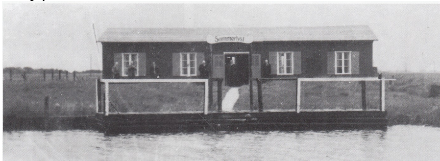
Det færdige resultat

Herefter blev det opført af foreningens medlemmer. Dengang som nu, man forstår at stå sammen. Efter 2 år blev en ny pavillon indviet