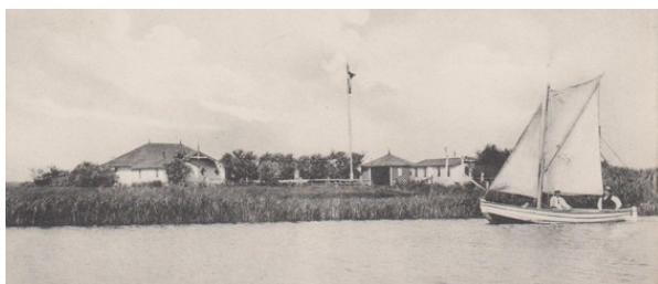
Gl. Sommerlyst klar til fest med flaget oppe og gæsterne på vej.

Medlemstallet steg, og Sommerlyst samlede mange af byens familier uden hensyn til rang og stand. De fleste af Sommerlysts medlemmer var håndværkere og handlende.