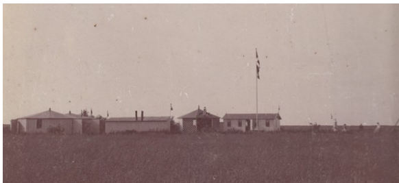
Gl. Sommerlyst omkring eller før 1900

Foreningen erhvervede i 1868 de smukke enge ved Vonåen og opførte et træhus. Formålet var at tage dertil og have nogle hyggelige timer sammen med Venner og familie. Siden byggedes der mere til, deriblandt en pavillon, også beregnet til dans. I et særligt hus var der indrettet et køkken.